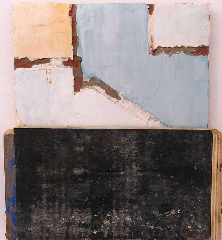
Elton Hipolito Sobre o pedaço de algum lugar # 8 2022 Tinta acrílica sobre cimenticola, massa corrida e tapume 37 x 33,5 x 5 cm