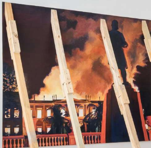
Elton Hipolito Processo de Tombamento #1 [ Museu Nacional ] 2022 Tinta acrílica sobre lona escorada por caibros de madeira 200 x 140 x 100 cm