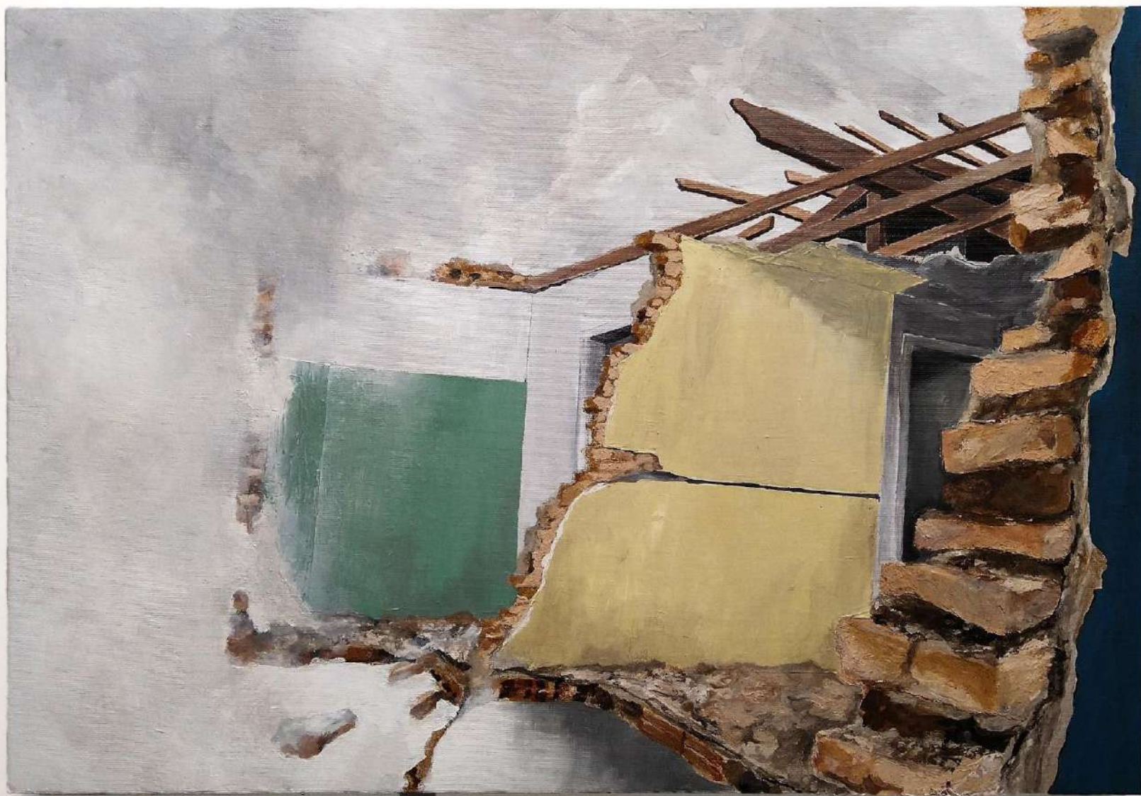
Elton Hipolito. O preço de nossas escolhas...2022 . Da série (In) Rupturas . Tinta acrílica e tinta preparada com tijolos coletados em demolição s/ tela. 40 x 60 cm.