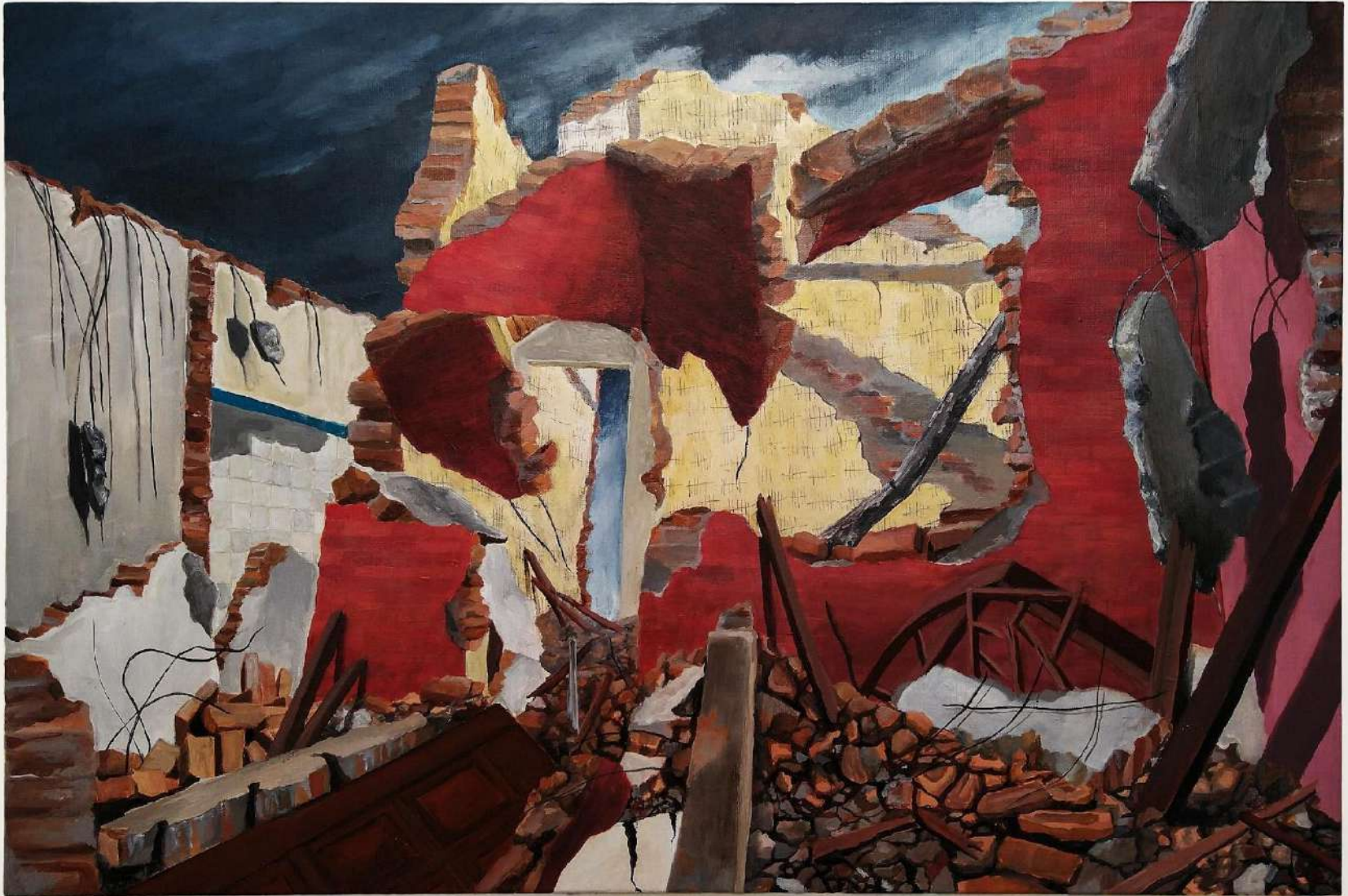
Elton Hipolito. Antes que a sua paranoia... 2021. Da série (In) Rupturas . Tinta acrílica e lápis grafite s/ tela. 40 x 60 cm