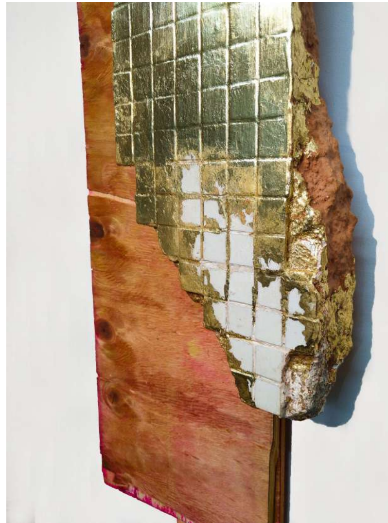
Elton Hipolito s/ título # 3, da série Fato Consumado . 2021 Escombro com azulejos coletado em demolição folheado a ouro (falsa) sobre tapume 55 x 26 x 7 cm Coleção particular