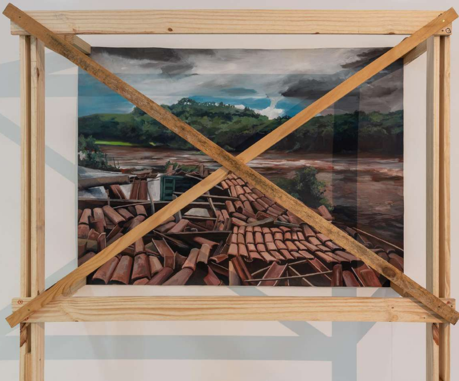
Elton Hipolito. Processo de Tombamento # 4 [ Brumadinho ] . 2023. Tinta acrílica sobre tecido e escoras de madeira. 200 x 160 x 52 cm.