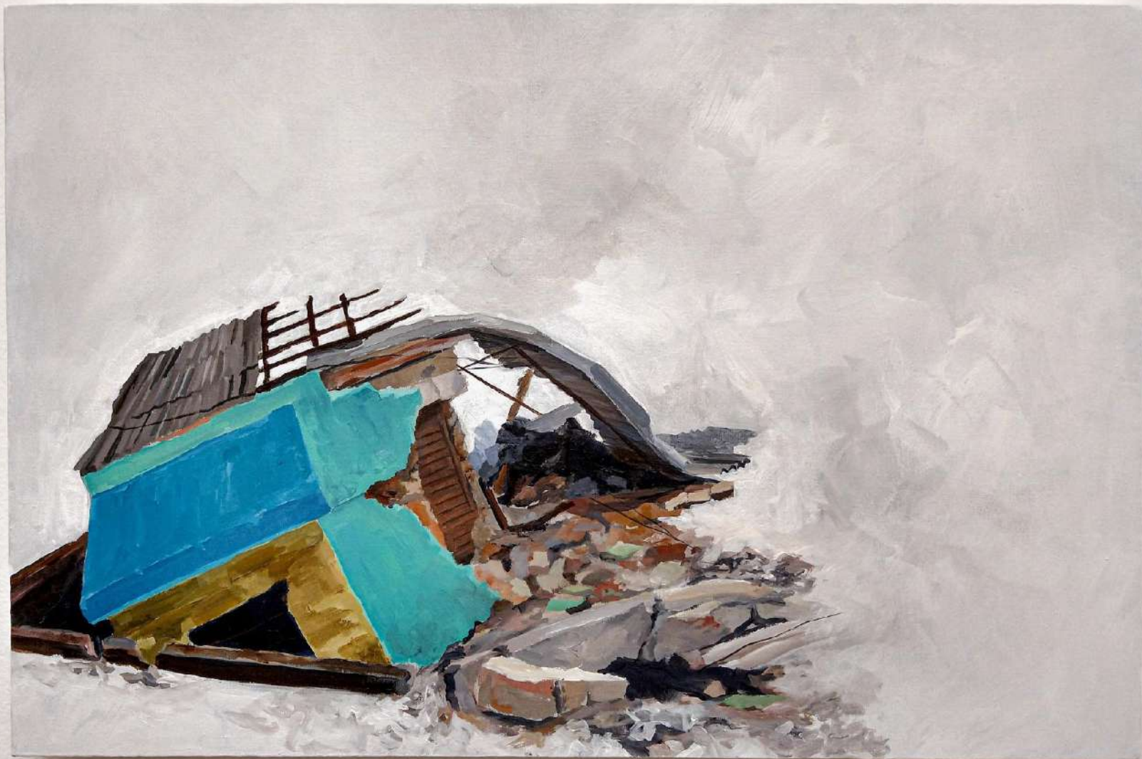
Elton Hipolito. Delírio Patriota... 2022. Da série (In) Rupturas . Tinta acrílica s/ tela. 40 x 60 cm