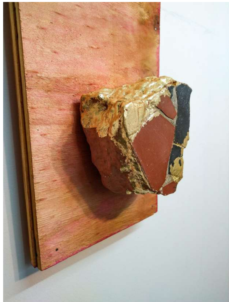
Elton Hipolito s/ título # 2, da série Fato Consumado . 2021 Escombros com azulejos coletado em demolição folheado a ouro (falsa) sobre tapume 54,9 x 20 x 8,5 cm Coleção Particular