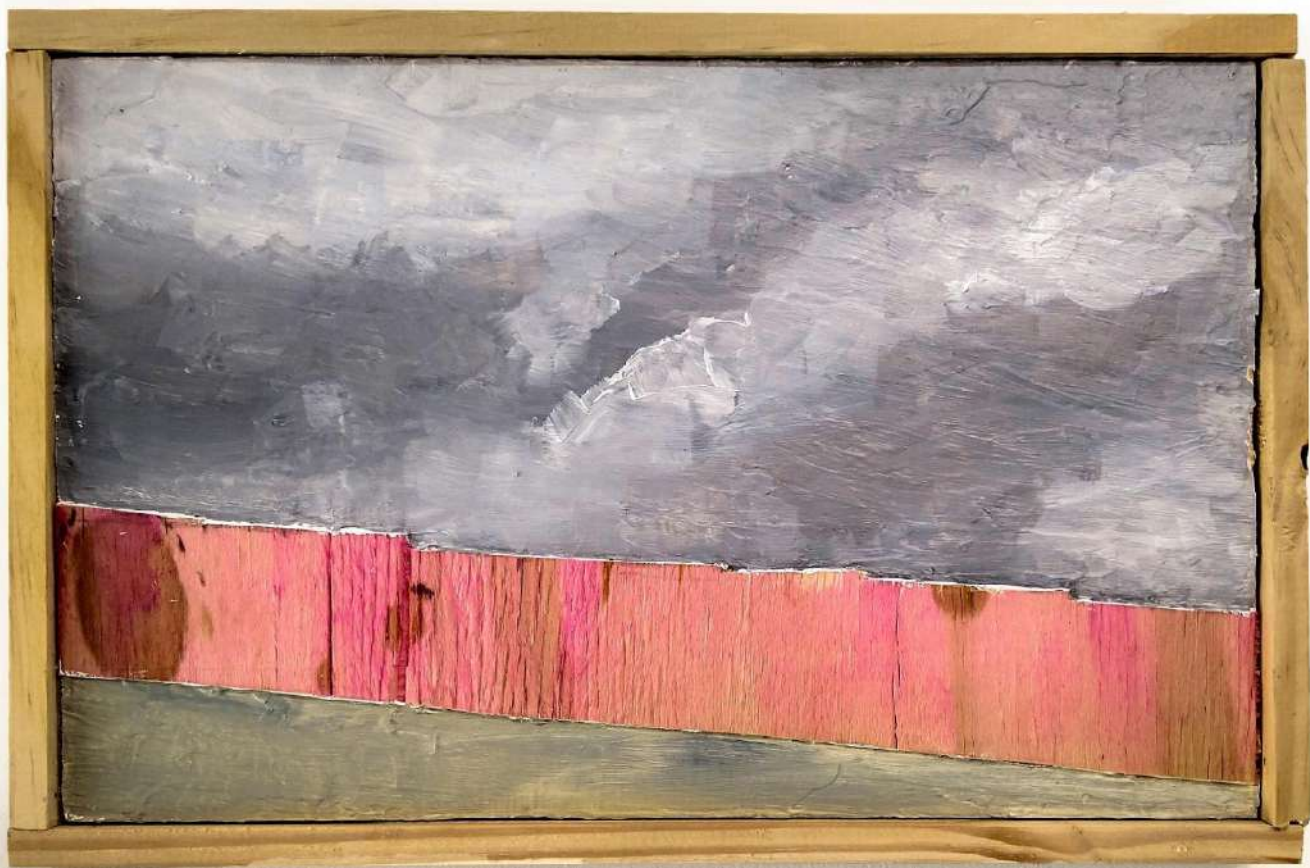
Sobre o pedaço de algum lugar #6 . 2021. Tinta acrílica sobre tapume de demolição. 22 x 33,5 x 3 cm