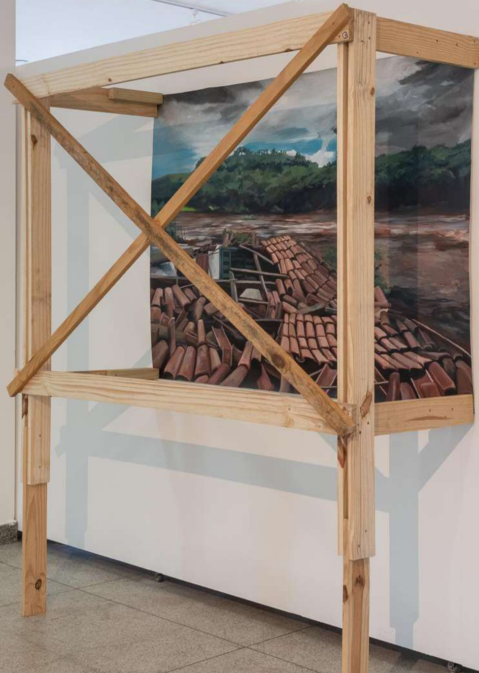
Elton Hipolito Processo de Tombamento # 4 [ Brumadinho ] 2023 Tinta acrílica sobre tecido e escoras de madeira 200 x 160 x 52 cm