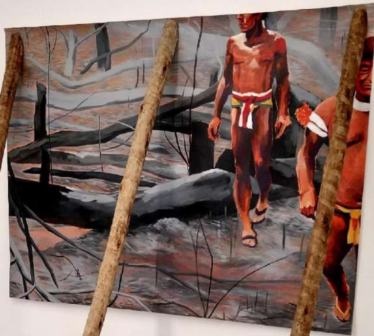
Elton Hipolito Processo de Tombamento #2 [ Amazônia em Chamas ] 2022 Tinta acrílica sobre lona escorada por toras de eucaliptos 200 x 145 x 115 cm