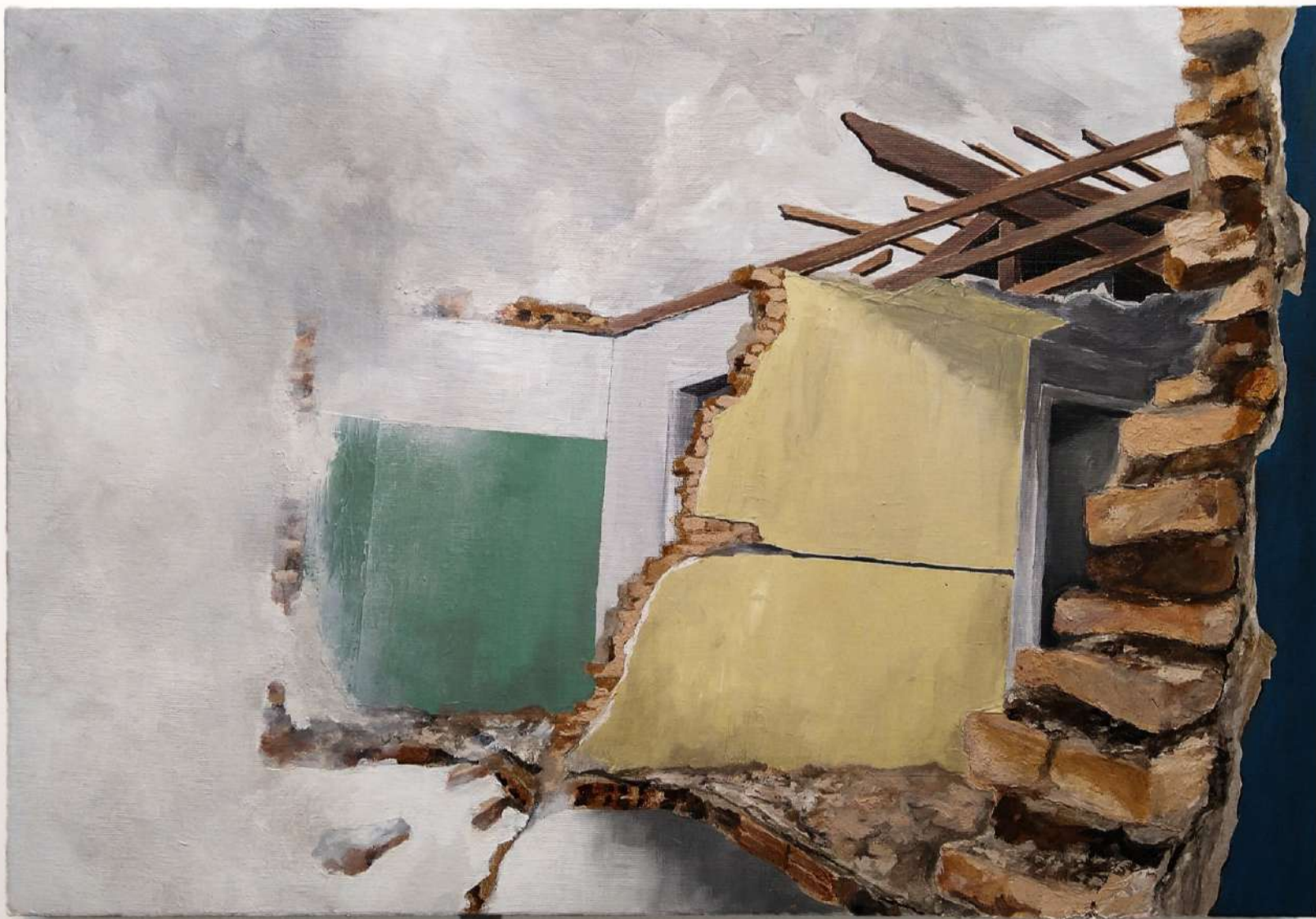
O preço de nossas escolhas... 2022. Da série (In) Rupturas . Tinta acrílica e tinta preparada com tijolos coletados em demolição s/ tela. 40 x 60 cm