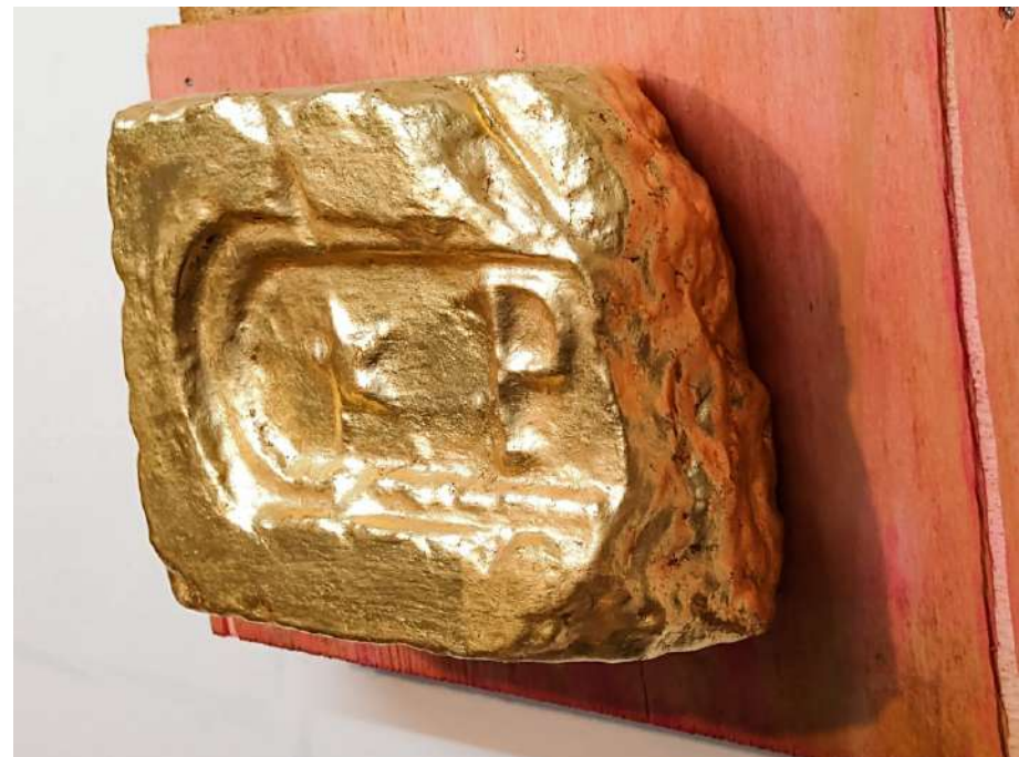
Elton Hipolito. s/ título # 1, da série Fato Consumado . 2021 Tijolo coletado em demolição com folha de ouro (falsa) sobre tapume. 19 x 31 x 11 cm Coleção Particular.