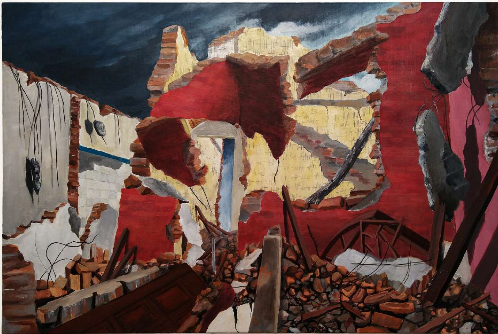
Antes que a sua paranoia... 2021. Da série (In) Rupturas . Tinta acrílica e lápis grafite s/ tela. 40 x 60 cm