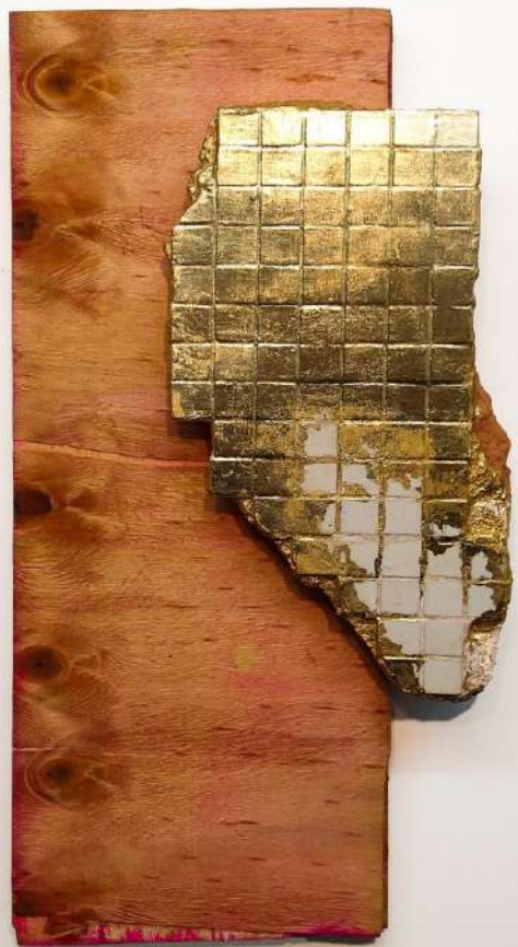
Elton Hipolito s/ título # 3, da série Fato Consumado. 2021 Escombros com azulejos coletado em demolição folheado a ouro (falsa) sobre tapume 55 x 26 x 7 cm Coleção particular