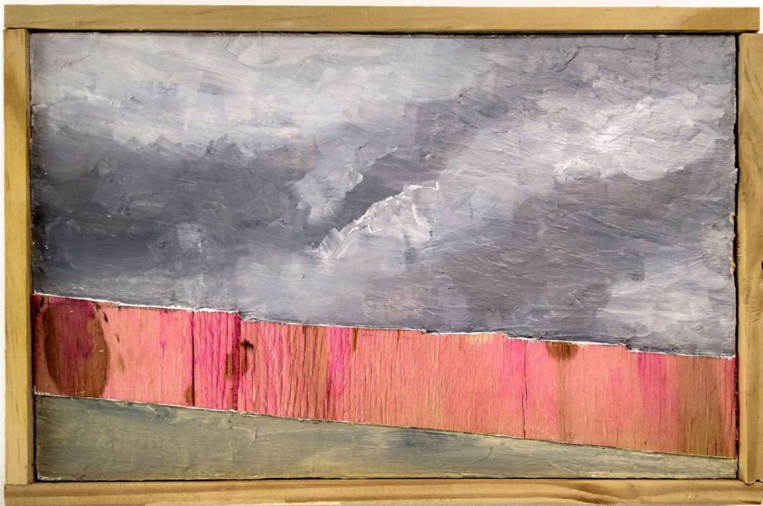
Sobre o pedaço de algum lugar #6. 2021. Tinta acrílica sobre tapume de demolição. 22 x 33,5 x 3 cm