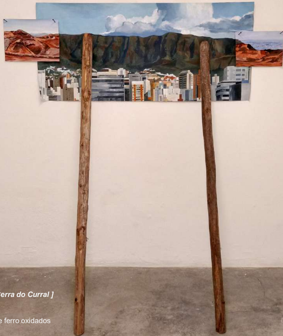
Elton Hipolito Processo de Tombamento #3 [ Serra do Curral ] 2022 Tinta acrílica sobre lona escorada por toras de eucalipto e pregos de ferro oxidados 200 x 206,5 x 115 cm.