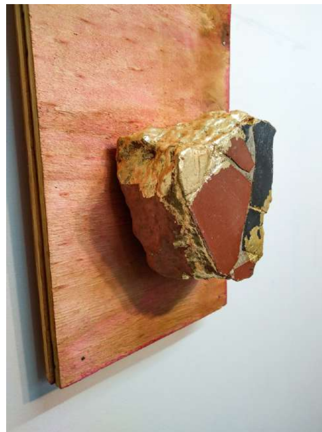
Elton Hipolito s/ título # 2, da série Fato Consumado . 2021 Escombros com azulejos coletados em demolição folheado a ouro (falso) sobre tapume 54,9 x 20 x 8,5 cm