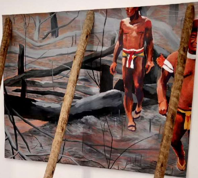
Elton Hipolito Processo de Tombamento #2 [ Amazônia em Chamas ] 2022 Tinta acrílica sobre lona escorada por toras de eucaliptos 200 x 145 x 115 cm