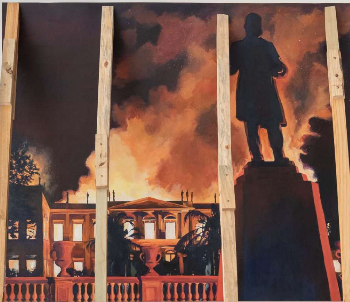
Elton Hipolito Processo de Tombamento #1 (Detalhe) 2022 Tinta acrílica sobre lona escorada por caibros de madeira 200 x 140 x 100 cm