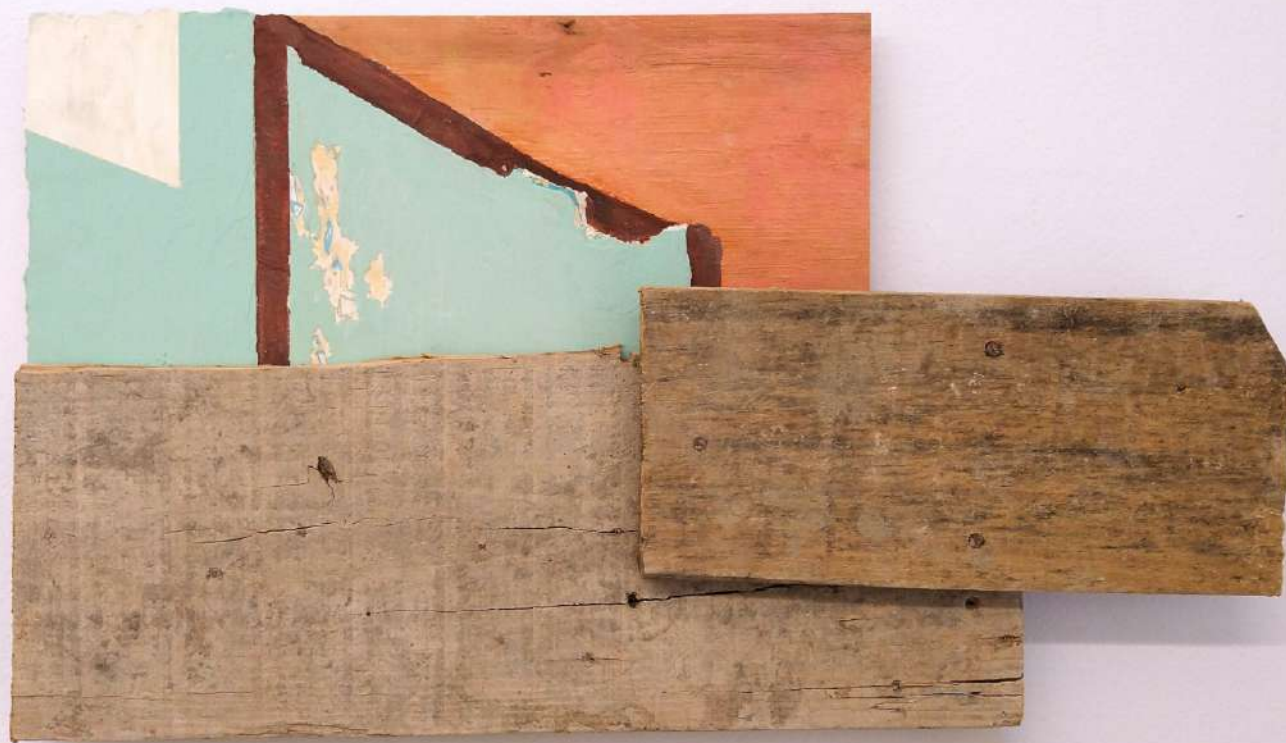
Elton Hipolito. Sobre o pedaço de algum lugar # 7 . 2022 Tinta acrílica sobre massa corrida sobre tapume. 37 x 66 x 5,5 cm