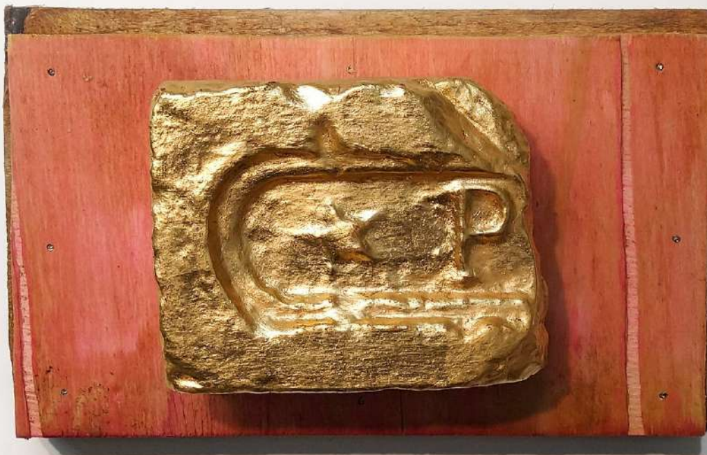
Elton Hipolito. s/ título # 1, da série Fato Consumado . 2021 Tijolo coletado em demolição com folha de ouro (falsa) sobre tapume. 19 x 31 x 11 cm Coleção Particular.