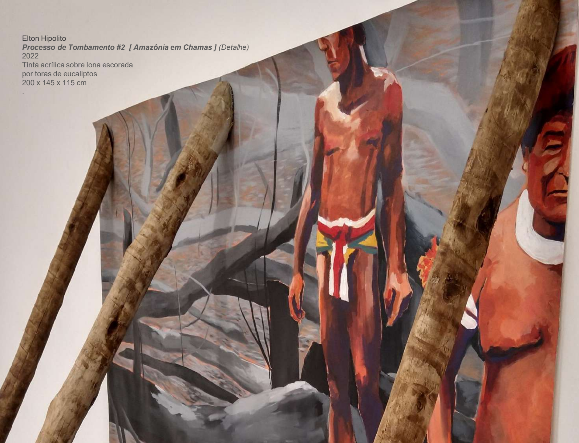
Elton Hipolito Processo de Tombamento #2 [ Amazônia em Chamas ] (Detalhe) 2022 Tinta acrílica sobre lona escorada por toras de eucaliptos 200 x 145 x 115 cm