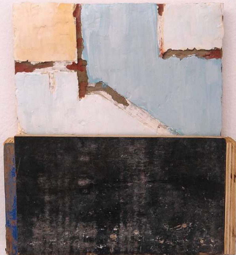
Elton Hipolito Sobre o pedaço de algum lugar # 8 2022 Tinta acrílica sobre cimenticola, massa corrida e tapume 37 x 33,5 x 5 cm